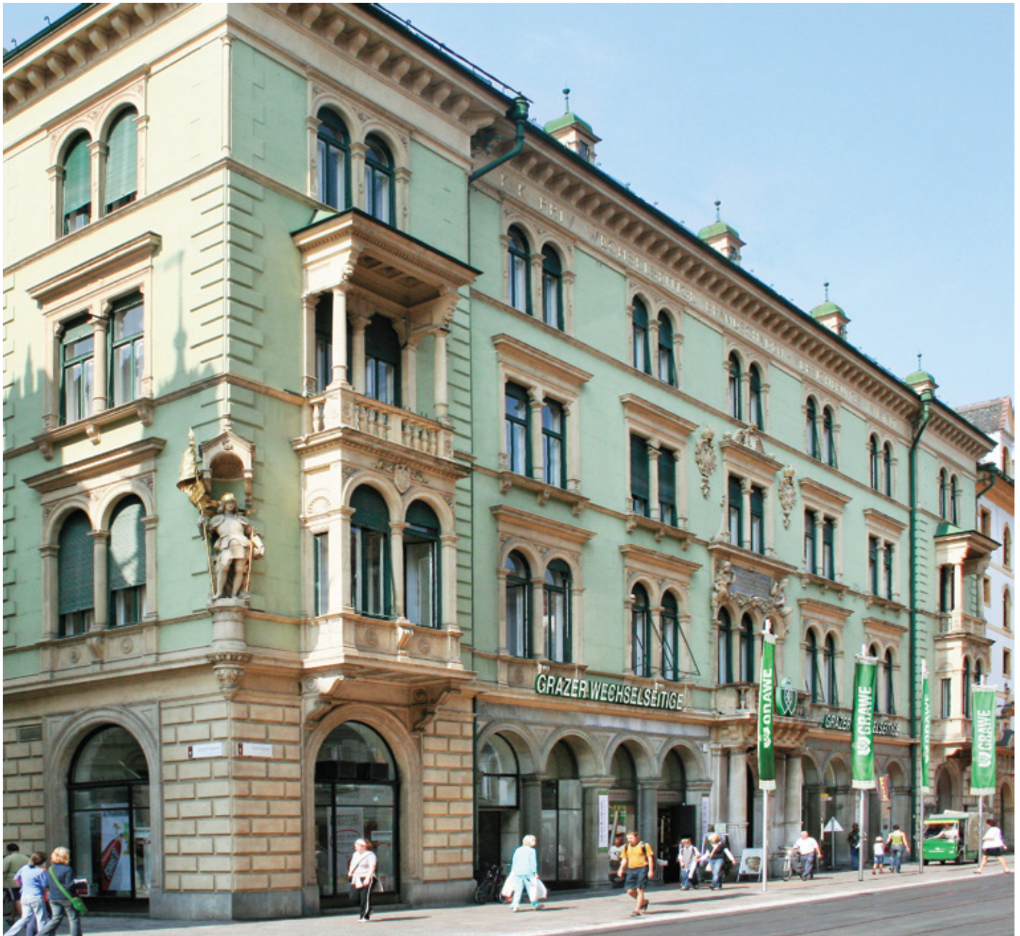
Центральний офіс у м. Грац

Індивідуальність кожної країни, національностей, людей, різноманіття їхніх цінностей, відносин, поєднується в єдине джерело, яке гарантує міць, силу та надає величі концерну GRAWE. Бути відкритим, розуміти потреби кожного клієнта, йти на зустріч, прагнути до нових досягнень, перспектив, позитивних змін – це головні завдання і складові стратегії подальшої діяльності всіх компаній у складі концерну. А комерційний успіх дає користь економіці кожної країни, де представлена страхова компанія концерну GRAWE.