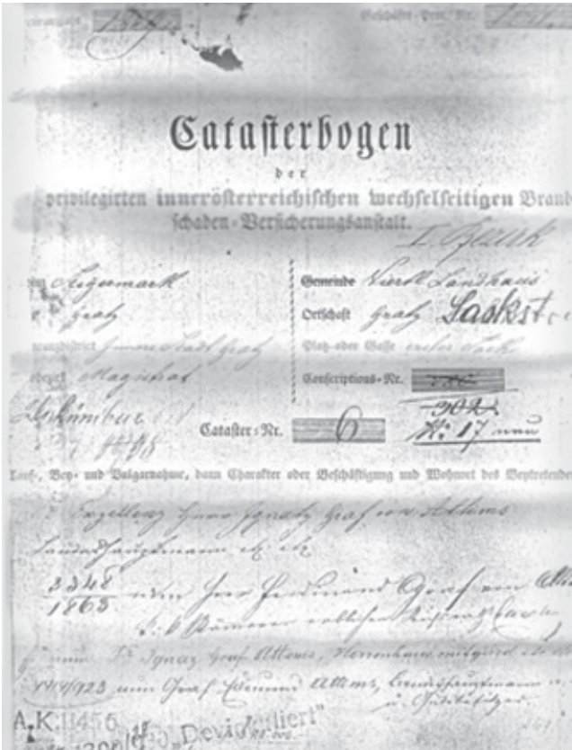
Договір укладений у 1829 р., який діє і донині

Десятки тисяч українських споживачів назвали «ГРАВЕ УКРАЇНА» найнадійнішою страховою компанією.