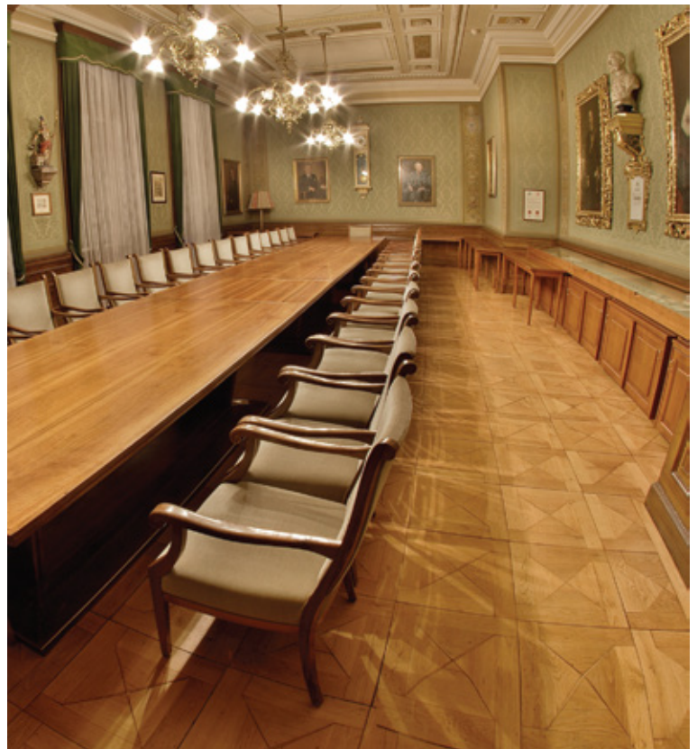
Зал засідань генеральної дирекції у м. Грац