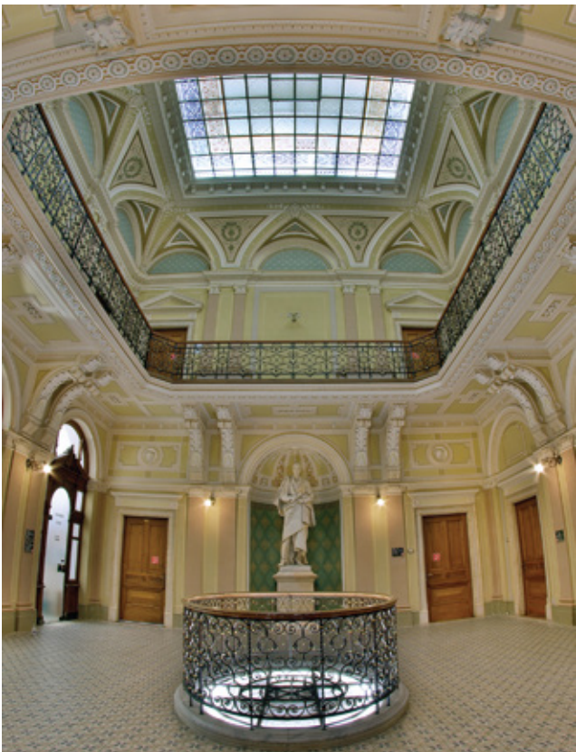
Хол генеральної дирекції у м. Грац

Національна комісія, що здійснює державне регулювання у сфері ринків фінансових послуг та Ліга страхових організацій України стверджують: «ГРАВЕ УКРАЇНА» — найстабільніша страхова компанія, що працює на теренах України, бере на себе фінансові зобов'язання й вчасно їх виконує.