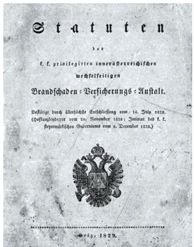
Статут 1829 р.

Висококваліфіковані спеціалісти компанії-засновника, головний офіс якого знаходиться в Австрії у місті Грац, координують роботу усіх компаній концерну, гарантуючи власним досвідом надійність та бездоганну якість обслуговування клієнтів.